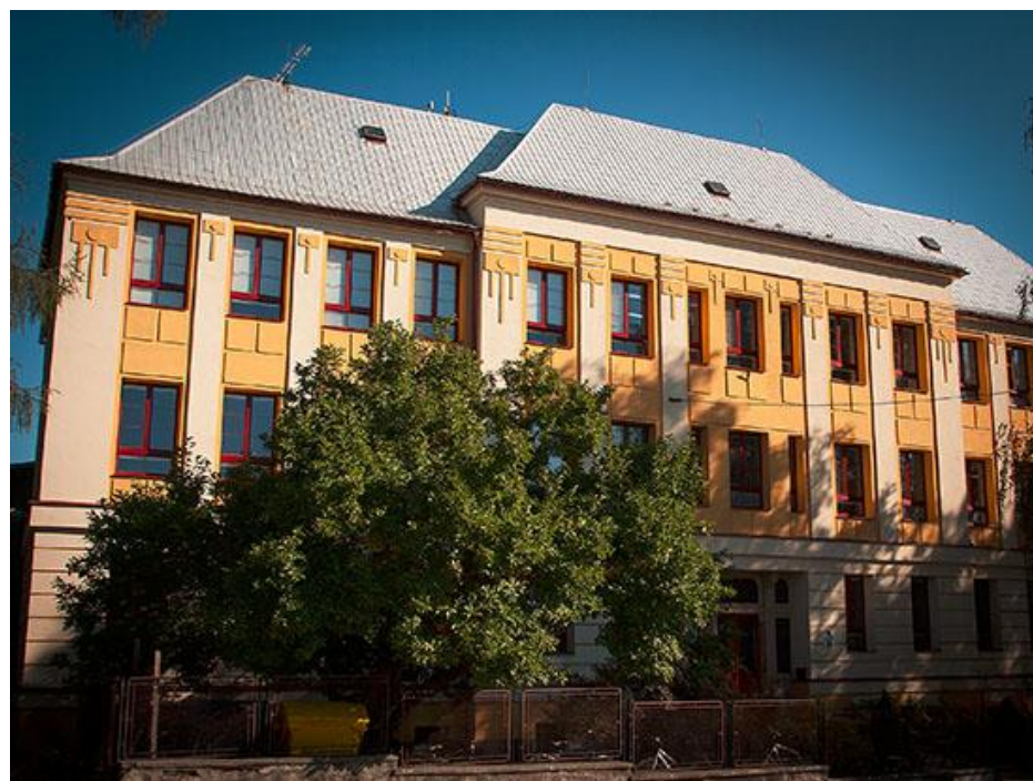
Základní škola Libina, příspěvková organizace